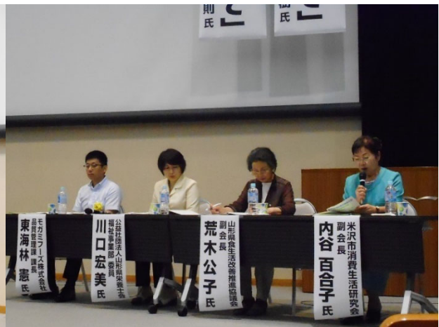
パネリストの皆さん